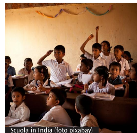
Scuola in India