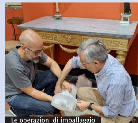
Le operazioni di imballaggio

Sono iniziati lunedì scorso i lavori di restauro dei busti dei Santi Pietro e Paolo, conservati nel Museo diocesano di Ferentino.