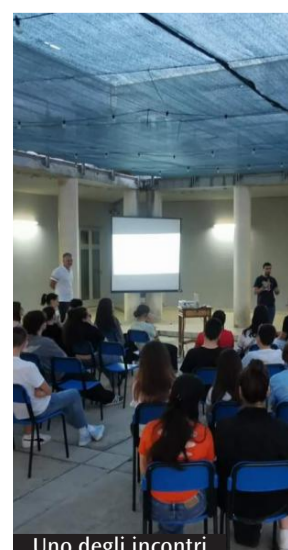
Uno degli incontri

Un nutrito gruppo di ragazzi e di ragazze provenienti da varie parrocchie e movimenti della diocesi hanno preso parte alle due serate di condivisione e di formazione promosse dalla Pastorale giovanile della diocesi di Frosinone-Veroli-Ferentino.