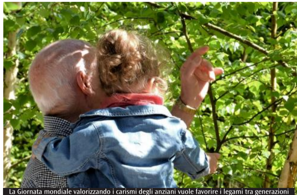
La Giornata mondiale valorizzando i carismi degli anziani vuole favorire i legami tra generazioni

valorizzando i carismi dei nonni e degli anziani e il loro apporto alla vita della Chiesa, vuole favorire l'impegno di ogni comunità ecclesiale nel costruire legami tra le generazioni e nel combattere la solitudine, consapevoli che - come afferma la Scrittura - "Non è bene che l'uomo sia solo" (Gen 2,18). Il cardinale Kevin Farrell, prefetto del Dicastero per i laici, la famiglia e la vita, nel commentare il testo, ha affermato: «Nel messaggio, il Santo Padre sottolinea come - a causa della crisi delle appartenenze comuni e dell'emergere di una mentalità sempre