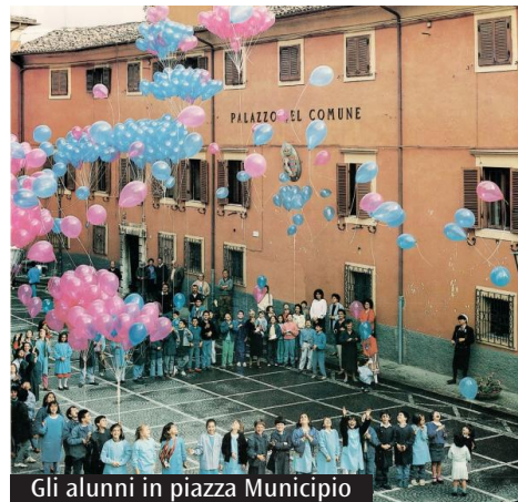
Gli alunni in piazza Municipio

Dopo la veglia interdiocesana in preparazione alla Pentecoste, c'è già un altro appuntamento in calendario. Infatti sabato 15 giugno ci sarà la "Festa dei giovani": una giornata all'insegna dello stare insieme tra divertimento e momenti di preghiera e riflessione. L'iniziativa si svolgerà presso il parco acquatico "Acquapark" ed è promossa dagli uffici di pastorale giovanile e i centri vocazionali delle diocesi di Frosinone-Veroli-Ferentino e di Anagni-Alatri. Sul sito internet della pastorale giovanile, digitando l'indirizzo https://pastoralegiovanile.diocesifrosinone.it , sono disponibili la locandina, i recapiti per iscriversi o per avere ulteriori informazioni.