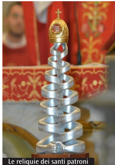
Le reliquie dei santi patroni

nelle varie parrocchie cittadine: fino a domani, presso santa Maria Goretti poi sarà la volta del Sacratissimo Cuore di Gesù. Mentre mercoledì 12 giugno sarà possibile prendere parte all'Udienza generale con Papa Francesco in piazza San Pietro (per informazioni ed iscrizioni rivolgersi alle parrocchie di Frosinone). Si ricorda inoltre che è possibile avere l'Indulgenza plenaria: per tutti fedeli che visiteranno la Cattedrale di Frosinone o le altre chiese parrocchiali della suddetta città, ma anche per i malati, gli anziani e coloro che saranno impossibilitati a recarsi nei luoghi di culto cittadini. (Ad. Cor.)