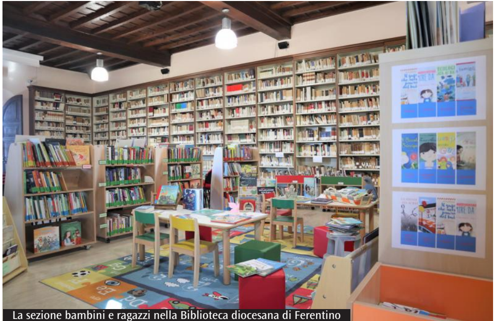
La sezione bambini e ragazzi nella Biblioteca diocesana di Ferentino

Di particolare interesse sono gli affreschi medievali staccati, una pregevole statua lignea del XV secolo e una piccola ma significativa sezione inerente ai paramenti liturgici: oltre alla mitra di Celestino V, a rotazione sono esposti i parati significativi per epoca, tipologia del tessuto e completezza dell'insieme. Grazie alla collaborazione con la Pro Loco di Ferentino il Museo accoglie i visitatori ogni fine settimana oppure in giorni e in orari concordati con i gruppi di turisti e le scolaresche (per informazioni è possibile rivolgersi al numero di telefono 0775-245775).