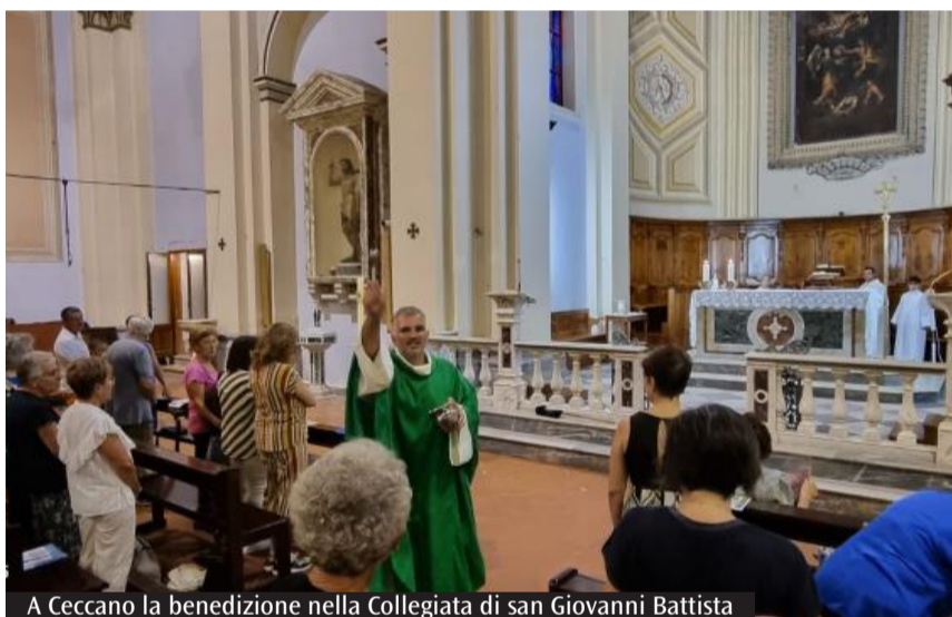
A Ceccano la benedizione nella Collegiata di san Giovanni Battista