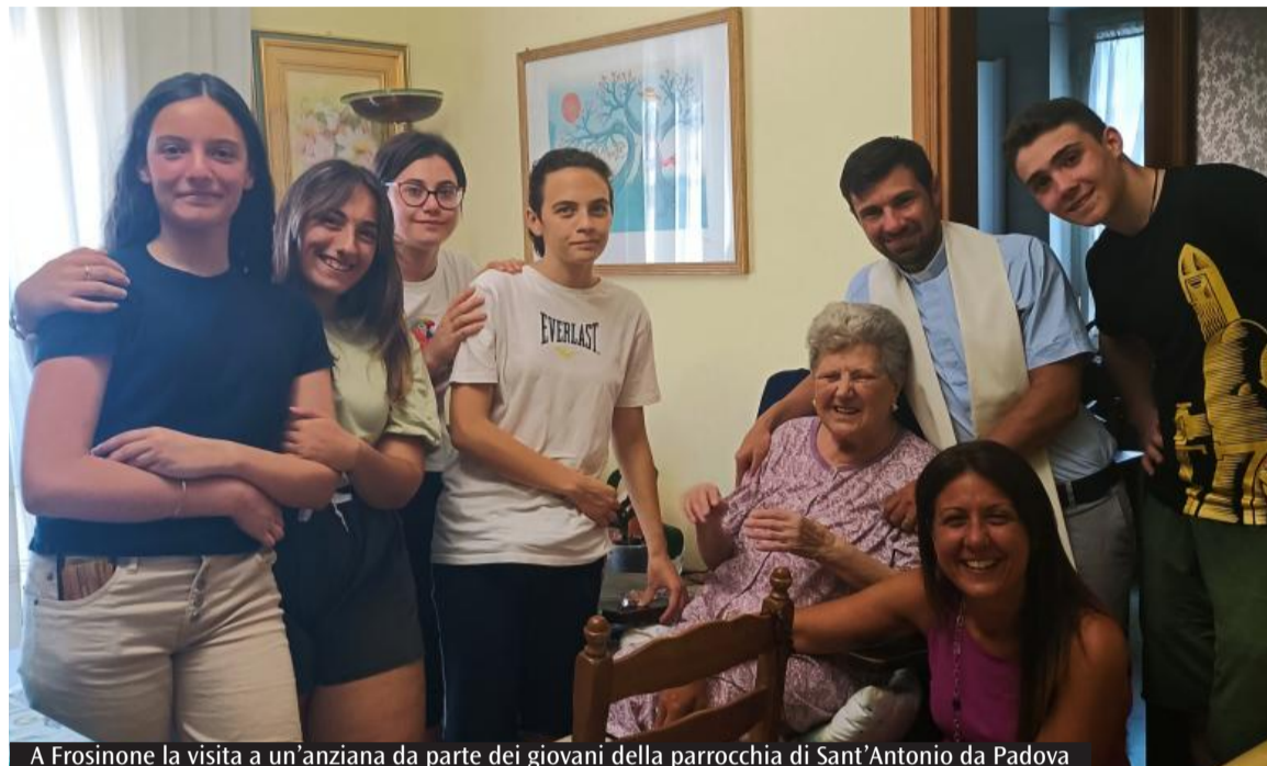
A Frosinone la visita a un'anziana da parte dei giovani della parrocchia di Sant'Antonio di Padova