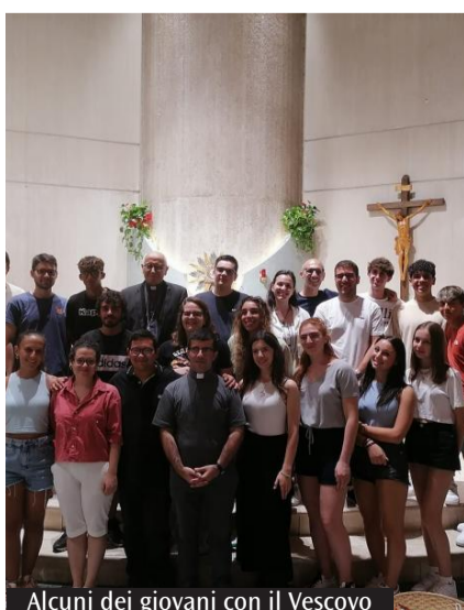
Alcuni dei giovani con il Vescovo

Anche dal nostro territorio i giovani sono in procinto di partecipare con il Santo Padre alla Giornata mondiale della Gioventù, in programma stavolta in Portogallo. Circa sessanta fanno parte del "Frosinone 3" il gruppo Scout Bronwsea della parrocchia di Madonna della Neve, mentre in 53 formano il gruppo interdiocesano delle diocesi di Frosinone-Veroli-Ferentino e di Anagni-Alatri. Nel dettaglio, il gruppo interdiocesano partirà, in autobus, martedì primo agosto e farà due soste: ad Avignone, presso l'Ostello Ymca Avignone e a Madrid (2 agosto) presso il Colegio Institución La Salle. Nel pomeriggio del 3 agosto arriveranno a Lisbona presso la struttura di accoglienza individuata dall'organizzazione centrale. Da quel momento in poi il gruppo entrerà ufficialmente nell'organ-