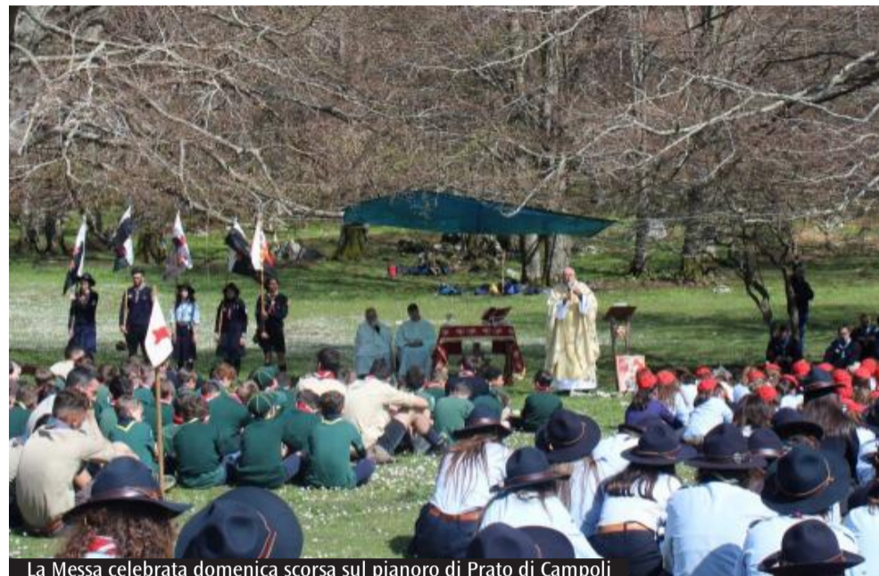
La Messa celebrata domenica scorsa sul pianoro di Prato di Campoli

Il distretto di Frosinone alla Messa conclusiva celebrata domenica scorsa dal vescovo Spreafico a Prato di Campoli