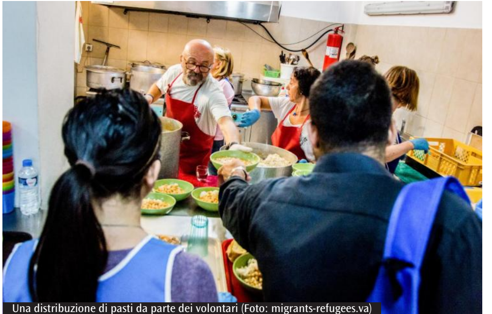
Una distribuzione di pasti da parte dei volontari

Segni e poi il 13 febbraio 2023 con il Rav. Benedetto Carucci Viterbo. Gli incontri ebraico-cristiani avranno luogo un lunedì al mese, dalle 18:00 alle 19:15: si potrà partecipare in presenza a Roma oppure seguendo la diretta streaming. Sul sito internet www.diocesifrosinone.it è disponibile una news dedicata all'iniziativa suddetta: si può consultare la locandina e il calendario completo, ed è pubblicato il link per la diretta. (Ad.Cor.)