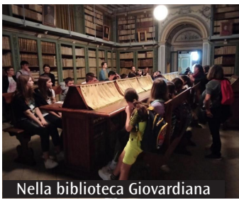
Nella biblioteca Giovardiana