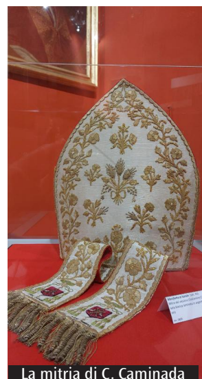
La mitria di C. Caminada

Ricorre oggi il 50° anniversario della morte del Vescovo di Ferentino, monsignor Costantino Caminada, avvenuta il 6 novembre del 1972.