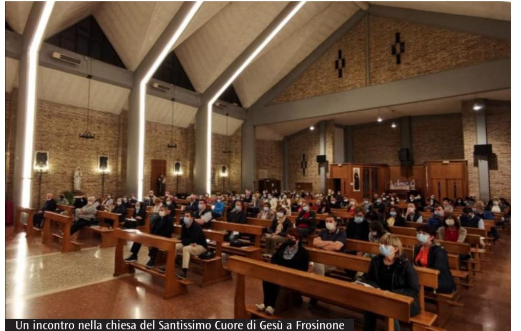
Un incontro nella chiesa del Santissimo Cuore di Gesù a Frosinone