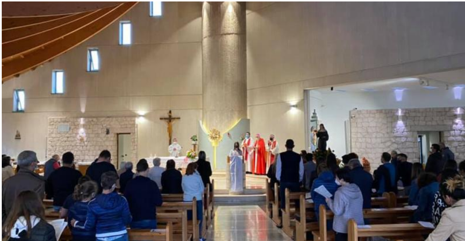
Nella chiesa di Santa Maria Goretti a Frosinone, il 20 maggio scorso la Veglia di preghiera organizzata dai vari Uffici diocesani in preparazione alla Pentecoste e presieduta dal vescovo Ambrogio Spreafico

Incontro per volontari ed operatori della Caritas.