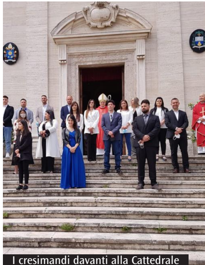
I cresimandi davanti alla Cattedrale