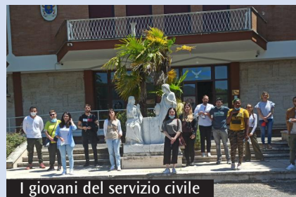
I giovani del servizio civile

In queste settimane, in ciascuna delle cinque vicarie che compongono il territorio della diocesi, sono in calendario gli