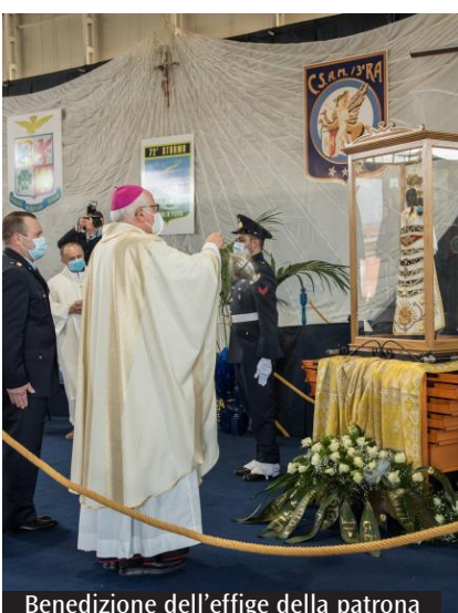
Benedizione dell'effigie della patrona

L unedì scorso presso il 72° Stormo di Frosinone si è celebrata una Santa Messa in occasione della presenza in base della sacra effigie della Madonna di Loreto, arrivata in aeroporto durante il suo viaggio itinerante tra i reparti dell'Aeronautica militare. La celebrazione Eucaristica è stata presieduta dal vescovo della diocesi di Frosinone-Veroli-Ferentino, monsignor Ambrogio Spreafico e concelebrata dall'abate dell'Abbazia di Montecassino, don Donato Ogliari, dall'abate dell'Abbazia di Casamari, don Loreto Camilli e dal vicario episcopale per l'Aeronautica militare, monsignor Antonio Coppola, alla presenza del Comandante del 72° Stormo, colonnello pilota Davide Cipelletti, di una rappresentanza di personale dell'aeroporto nonché di rappre-