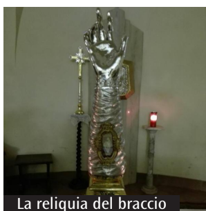
La reliquia del braccio

Domani sarà possibile seguire in diretta la benedizione con la reliquia e la preghiera al cimitero e in differita la Messa (a partire dalle 19) collegandosi alla pagina https://www.facebook.com/parrocchiesupino