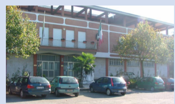
La Curia vescovile

Per le festività Natalizie chiuderanno al pubblico tutti gli uffici diocesani, ma con tempi e modi differenti. Gli uffici della curia vescovile di Frosinone - sita in viale Volsci - sospenderanno il ricevimento al pubblico a partire da mercoledì 23 dicembre 2020 e fino a lunedì 4 gennaio 2021.