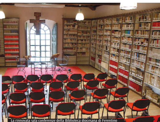
La rinnovata sala conferenze della Biblioteca diocesana di Ferentino

con le quali sarà possibile accedere ai vari luoghi e partecipare alle singole attività da essi promossi. La card, che ha un costo di cinque euro, ha validità 12 mesi dalla data di attivazione e permette di accedere a tutti i luoghi della cultura che hanno aderito al progetto provinciale (musei, biblioteche e archivi), così come di partecipare ai