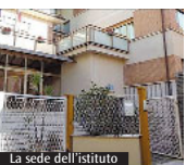
La sede dell'istituto

paritaria-parificata "Madre Caterina Troiani". Come illustrato nella comunicazione scritta ricevuta dai genitori degli allievi e dal personale in servizio nella struttura del centro di Ferentino,