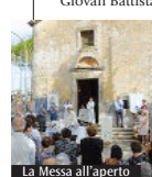
La Messa all'aperto

Venerdì Giornata dei giovani: alle 19 celebrazione eucaristica presieduta da don Francesco Paglia e alle 20 Processione con san Rocco dalla Parrocchia Santissima del Crocifisso fino a Sant'Erasmo. Nel pomeriggio di sabato: alle 15.30 Santo Rosario, poi Processione con San Rocco da Sant'Erasmo alla Parrocchia Santissimo Crocifisso; alle 18.00 Celebrazione eucaristica del 50° presieduta dal vescovo diocesano monsignor Ambrogio Spreafico. Domenica prossima, invece, il programma prevede alle 18.30 il Santo Rosario e alle 19 Solenne Messa di ringraziamento presieduta da don Giuseppe Principi con la presenza di tutti i sacerdoti che hanno servito la parrocchia.