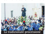
La tradizionale processione

gaglia. Sabato 26 settembre, alle ore 11.00 Messa con amministrazione dell'Olio degli Inferni e supplica al santo per gli ammalati; alle 16.30 benedizione della mamme e