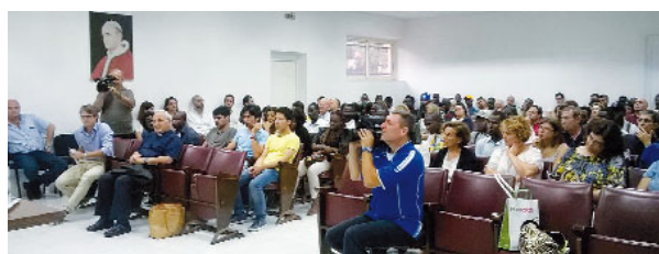
Gli intervenuti all'incontro con i migranti nel luglio scorso