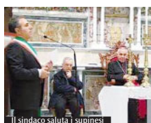
Il sindaco saluta i supinesi

fraternità e gioia. Bellissimi i canti eseguiti da un coro inserito nell'assemblea che ha aiutato tutti a partecipare in modo coinvolgente, segno della vitalità di questa parrocchia". Una simpatica sorpresa è stato il risveglio alle 6.30 al nullo dei tamburi che giungendo per il paese ricordavano a tutti di vivere quel giorno nella misericordia (tema del nostro Cataldiano) in preparazione all'anno giubilare. Piccoli segni che mettono subito il cuore e la mente in Dio. La messa della domenica mattina è stata presieduta dal nostro Vicario Generale, mentre alla sera c'è stata una concelebrazione con il parroco ed è stata impartita la benedizione solenne con la reliquia, siamo