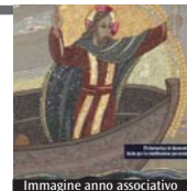
Immagine anno associativo