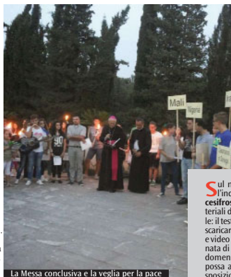
La Messa conclusiva e la veglia per la pace

Ognuno è responsabile per la creazione della pace" questo il messaggio del vescovo per i suoi giovani. "Siate costruttori di pace! Siate nel mondo cristiani responsabili, leali e veri! Senza cadere all'individualismo e all'indifferenza davanti al dolore degli altri". Così il vescovo esortava le nuove generazioni, invitando a portare il messaggio a chi ancora troppo freddo verso l'amore della chiesa. I ragazzi, dal canto loro, hanno raccontato del loro impegno: c'è chi visita gli anziani, chi aiuta nel doposcuola... Poi, i ragazzi e tutti gli altri partecipanti all'Assemblea Ecclesiale, dopo i lavori nei gruppi di studio, si sono ritrovati sul sagrato dell'Abbazia per pregare per la pace e dar vita alla fiaccolata che si è mossa fra i giardini del ginnasio, con una preghiera, silenziosa e gioiosa. Straziante la lettura di tutti i popoli dilaniati dalle guerre. Nella giornata di domenica i lavori sono ripresi con le riflessioni emerse dal lavoro