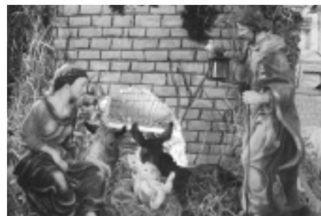
Un'istantanea della Natività

È interessante, poi, che l'intero presepe sia ricomponibile e che, quindi, potrà essere