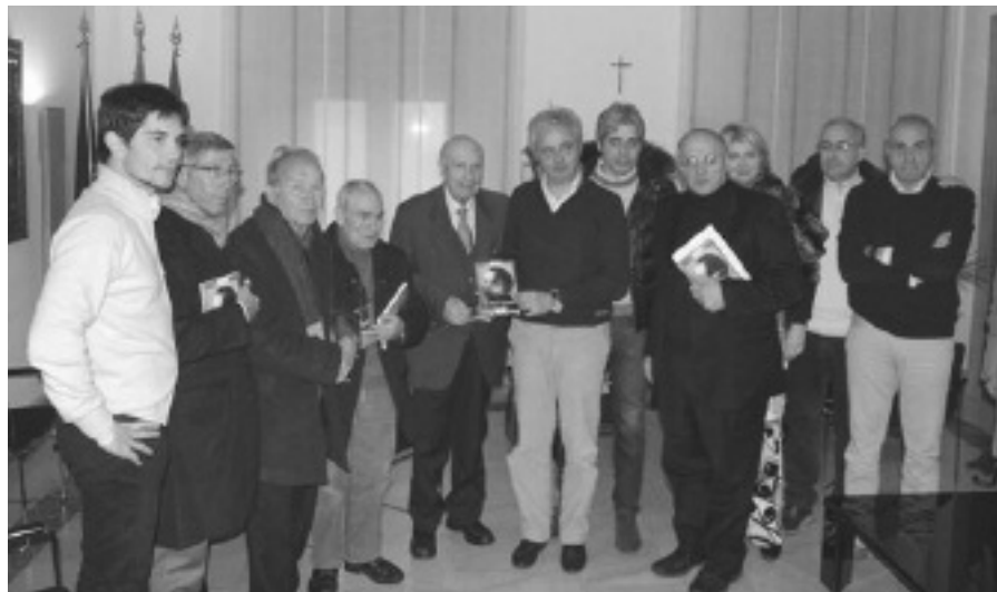
Un momento della presentazione del volume