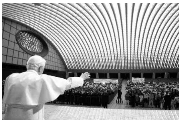
L'ingresso del Santo Padre nell'Aula Nervi