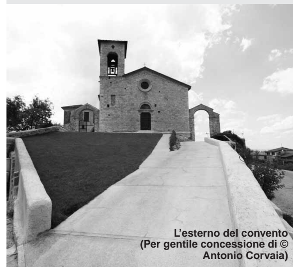
L'esterno del convento

http://www.parrocchiasantantonioabate.com