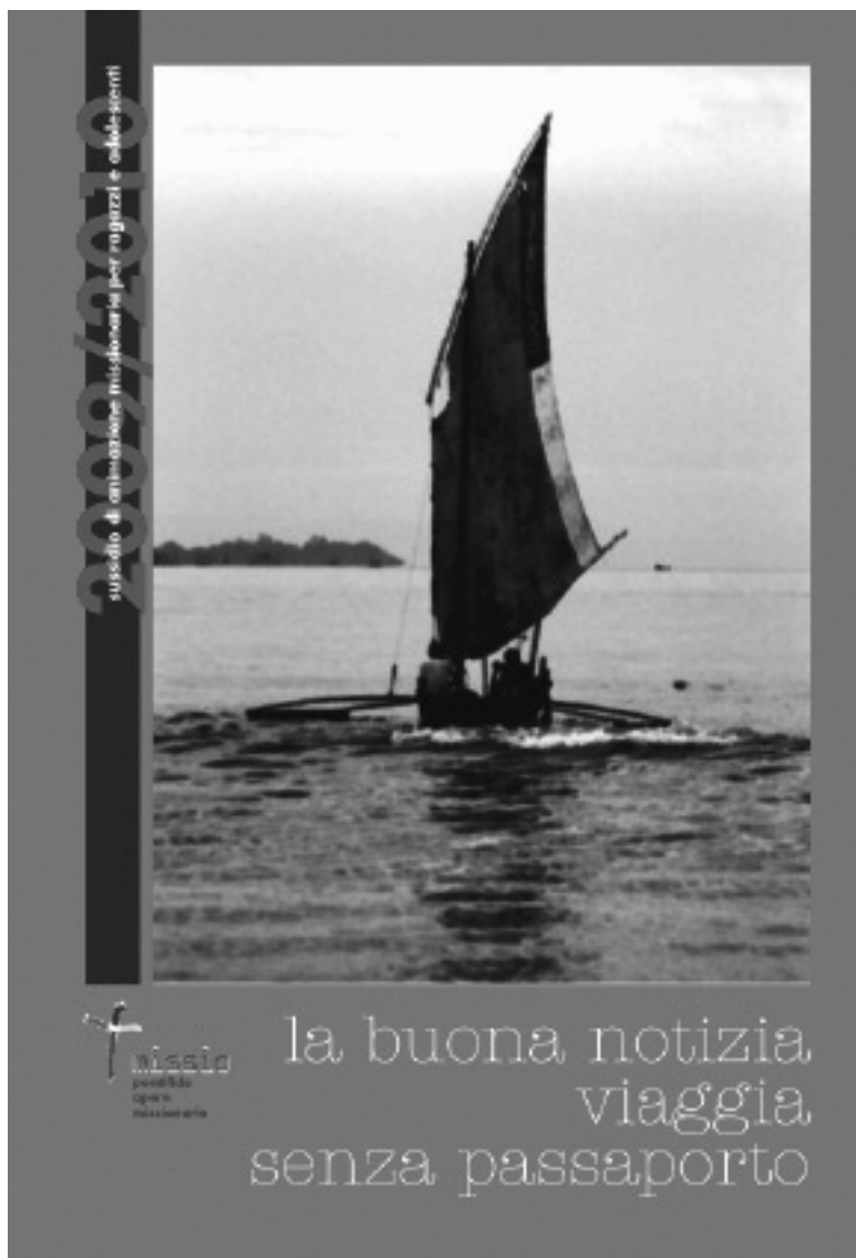
La copertina del sussidio 2009/2010

Il 6 gennaio di ogni anno, festa dell'Epifania del Signore, in tutto il mondo si celebra la Giornata missionaria mondiale dell'infanzia. La Giornata, ratificata da Papa Pio XII nel 1950, fu voluta nel 1843 dal vescovo di Nancy, mons. Charles de Forbii Janson, che con il suo zelo missionario, nel 1835, colpito dal dramma dei bimbi cinesi venduti per pochi soldi dalle loro famiglie, comincia ad occuparsi personalmente di tale problema. Coinvolgendo in tale missione tutti i bambini cristiani per aiutare altri bambini ad incontrare il Signore, chiede loro di aderire con la preghiera, il sacrificio ed una piccola offerta: il tutto frutto di una carità apostolica e solidale, cioè con uno spirito genuinamente missionario.