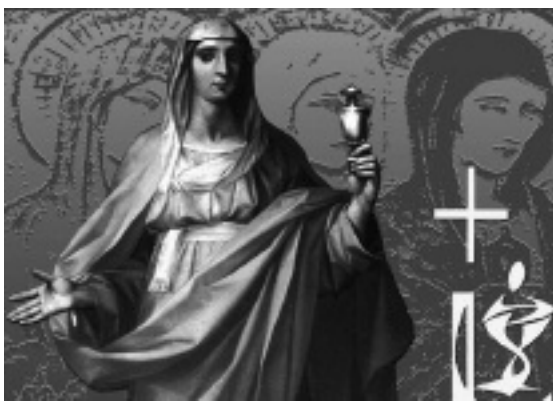
Nel pomeriggio di oggi la conclusione del Giubileo di Santa Maria Salome, patrona della Diocesi e della città di Veroli

Nell'edizione di domenica prossima proporranno un ampio servizio sul Convegno, e già dalle prossime ore materiali e fotografie saranno disponibili sul sito internet diocesano all'indirizzo www.diocesifrosinone.com .