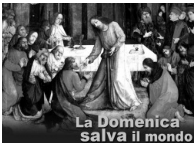
In copertina la "Comunione degli Apostoli" di Giusto di Gand, 1474, Urbino

Chi desiderasse averla può rivolgersi presso la segreteria della Curia, in via dei Monti Lepini 73 a Frosinone, durante il normale orario di ufficio.