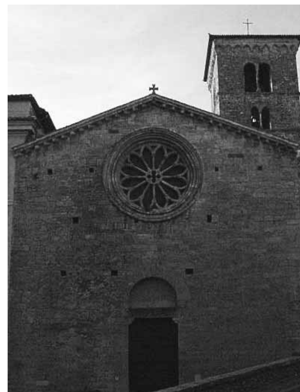
L'esterno della chiesa di S. Francesco