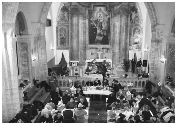
Alcune istantanee del pranzo realizzato a Ferentino