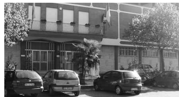
Esterno dell'Episcopio, in via dei Monti Lepini, a Frosinone

Si ricorda che in occasione delle festività natalizie, gli uffici di Curia resteranno chiusi fino a mercoledì prossimo, 7 gennaio 2009.