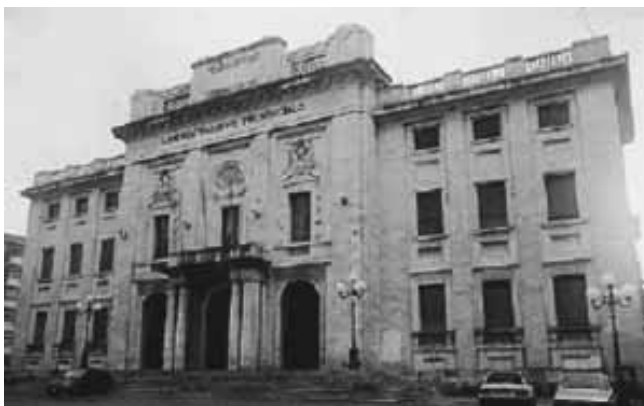
La sede dell'Amministrazione Provinciale

La presentazione del volume "Guida agli archivi parrocchiali e diocesani" avrà luogo dopodomani, martedì 24 marzo, alle ore 10.00 presso il salone di rappresentanza della Amministrazione Provinciale di Frosinone in piazza Gramsci.