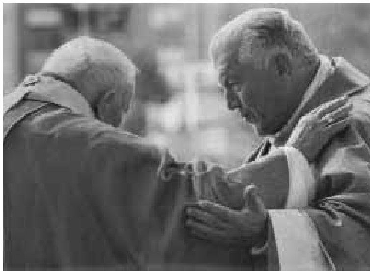
La celebre foto che ritrae don Salvatore con Giovanni Paolo II, a Frosinone (settembre 2001)

Domani pomeriggio, nella cappella dell'Episcopio