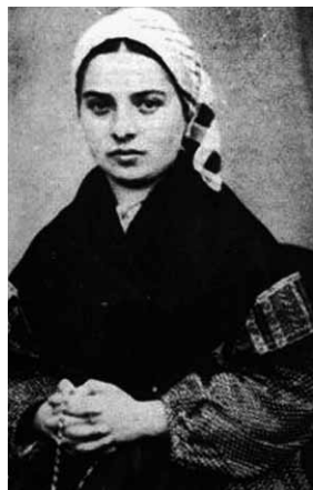
Santa Bernadette Soubirous

Il nostro ufficio pellegrinaggi per l'anno 2009 ha organizzato diversi pellegrinaggi nel Santuario di Lourdes in aereo, in treno e in nave, per attingere alle sorgenti di quella gioia che abbiamo ricevuto durante il 150esimo anniversario delle apparizioni.