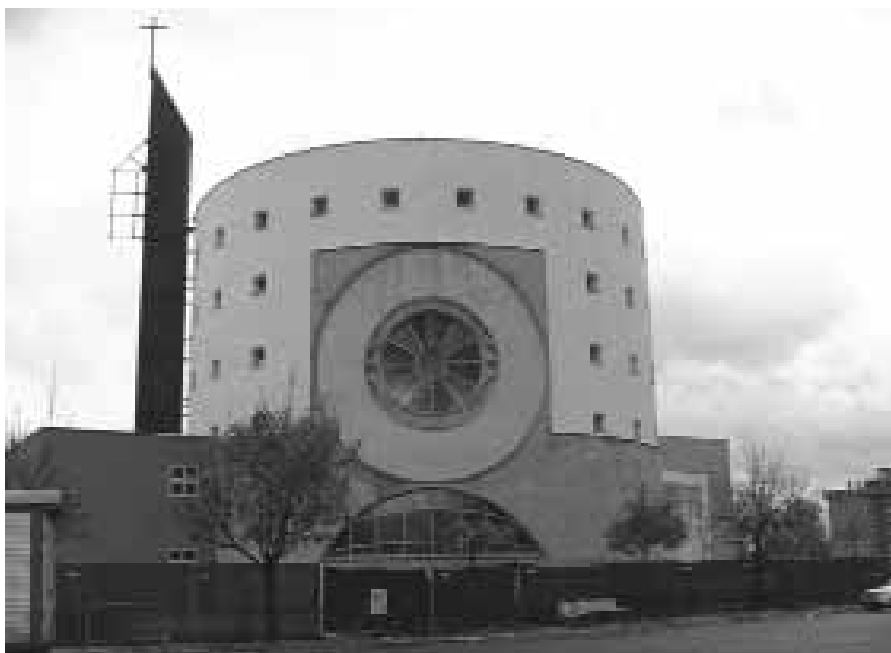
Sopra, la chiesa frusinate dedicata a San Paolo Apostolo. A sinistra, S. E. Ambrogio Spreafico

L'incontro avrà inizio a partire dalle ore 18,30 e sarà presieduto dal Vescovo diocesano, S. E. Ambrogio Spreafico e da S. E. Gennadios di Nilopolis, se-