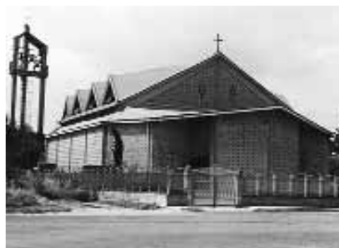
La parrocchia del S. Cuore

che nell'arco dell'intera giornata avrà luogo nel piazzale antistante la parrocchia; in serata, invece, Spettacolo Musicale dell'orchestra "Nuova Dimensione" e, a conclusione, spettacolo pirotecnico da gustare...con il naso all'insù.