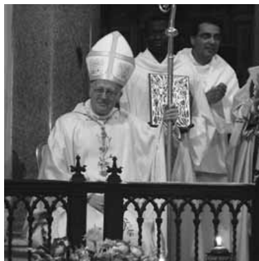
Subito dopo l'ordinazione