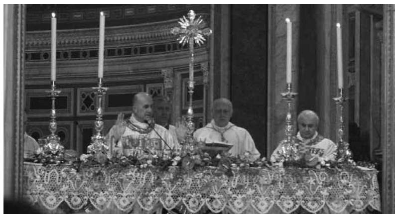
Un momento della celebrazione con il card. Bertone

Infine, prima della conclusione della cerimonia, i nuovi Vescovi hanno preso parola: nel box vi proponiamo il testo del ringraziamento di Mons. Spreafico.