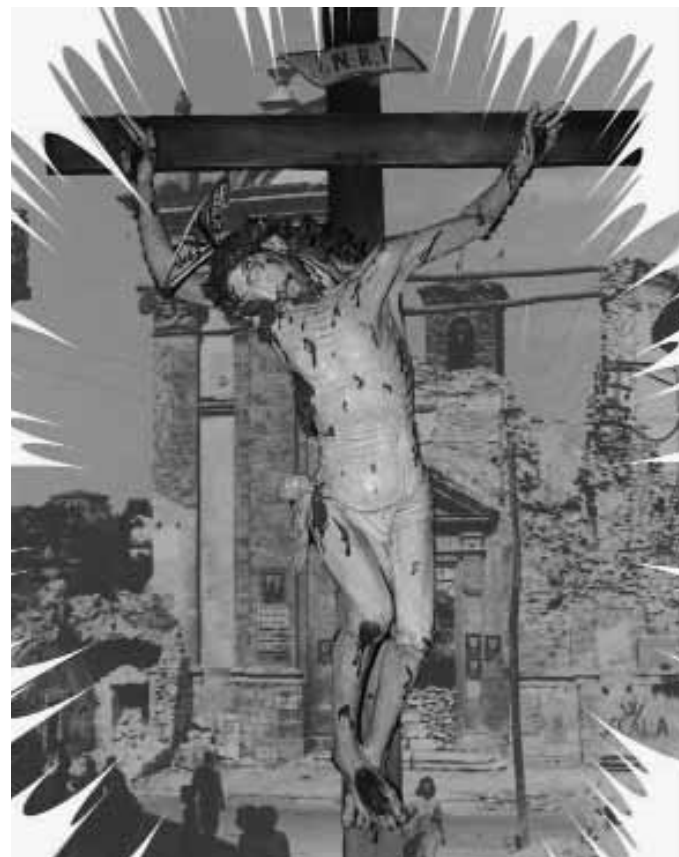
Il logo scelto per l'anniversario

Domenica prossima, vi proporremo un ampio fotoservizio sulle celebrazioni della scorsa settimana per la ricorrenza dei 50 anni dalla nascita della parrocchia nella popolosa frazione di Anitrella.