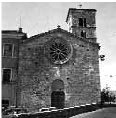
L'esterno della parrocchia di S. Francesco