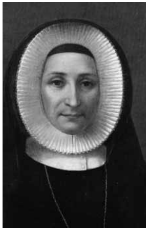
Due immagini della Santa della Valle