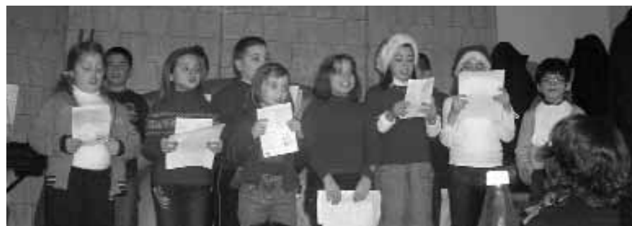
Due momenti della festa

Buon Natale nella luce, nella gioia e nella pace del Signore!