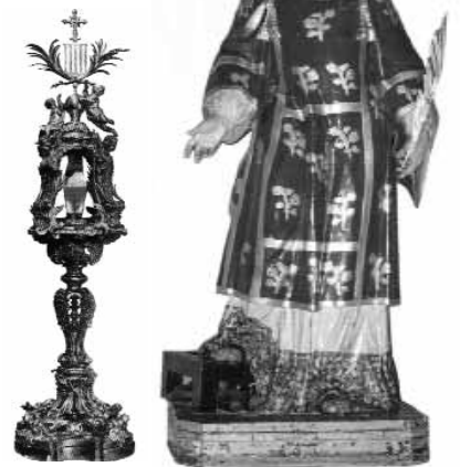
La statua e la reliquia di S. Lorenzo

te invitate tutte le Confraternite della Diocesi di Frosinone-Veroli e alcune altre che con Amaseno e San Lorenzo hanno una particolare affinità (San Lorenzello, Priverno, Pastena, etc.).