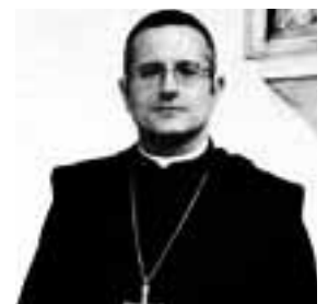
L'Abate di Montecassino, Dom Pietro Vittorelli, sarà a Supino il 30 agosto

Domenica 31 agosto: alle ore 19 S. Messa solenne e benedizione dei coniugi che celebrano il 25° e il 50° anniversario di matrimonio nel 2008.