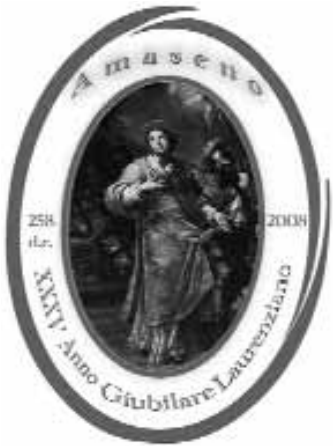
Il logo dell'anno laurenziano

Anche quest'anno, come in passato e sin da tempi immemori, la Comunità cristiana e non di Amaseno, con il mese di Agosto, si appresta a festeggiare il Suo Santo