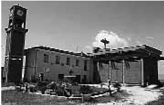
Due immagini, una della parrocchia di S. Sosio e una della Madonna di Medjugorje