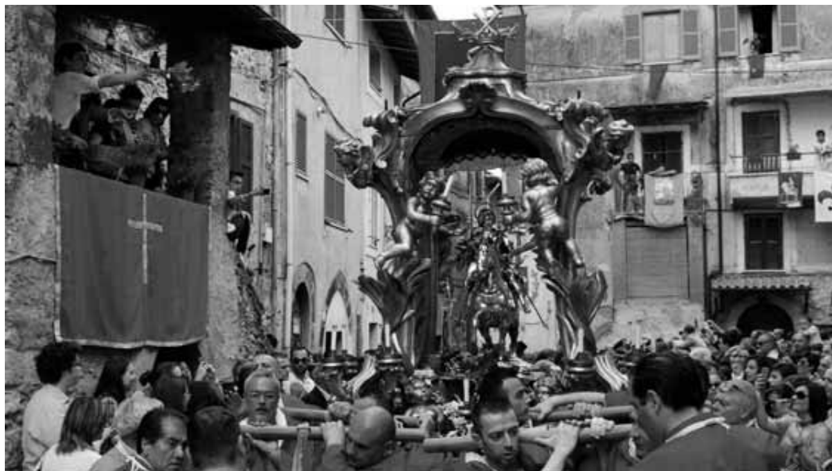
Un'immagine d'archivio della Processione che si snoda per le vie della città con la statua del Santo Patrono