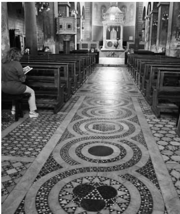
L'interno della Concattedrale di Ferentino

Il programma delle celebrazioni è scaricabile insieme a tante informazioni sulla Basilica e sulla storia della festa dal sito internet della Concattedrale all'indirizzo http://www.cattedraleferentino.it .