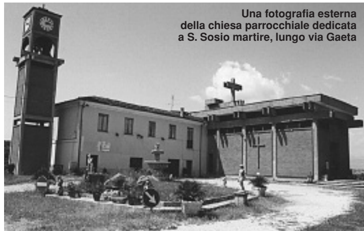
Una fotografia esterna della chiesa parrocchiale dedicata a S. Sosio martire, lungo via Gaeta

Sabato prossimo, in serata, la processione