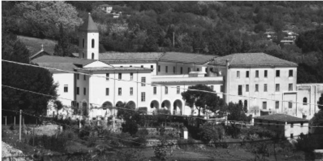
Una veduta del complesso che ospita la comunità passionista in località Badia, a Ceccano

giosa, spazio alla dimostrazione di tiro con l'arco mentre, a mezzogiorno, è in programma la partita di calcetto. Paura pranzo alle 13.00 e (dalle 15.00) ci sarà la dimostrazione di equitazione per disabili. La giornata di sport e divertimento si concluderà nel tardo pomeriggio con la premiazione degli atleti e la cerimonia di chiusura.