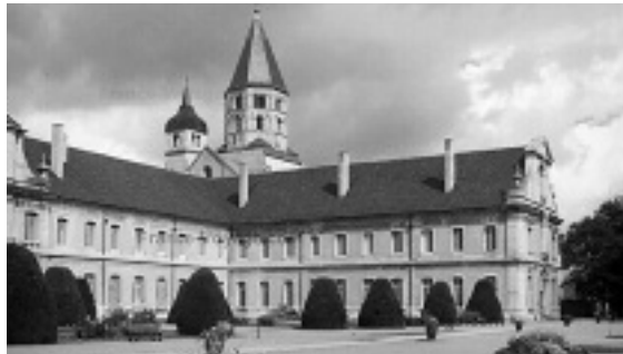
L'Abbazia di Cluny, la cui visita è inserita nel pellegrinaggio Lourdes, Nevevers paray le monial nel mese di ottobre

Pompei: pellegrinaggio della durata di un giorno il 21 ottobre p.v..