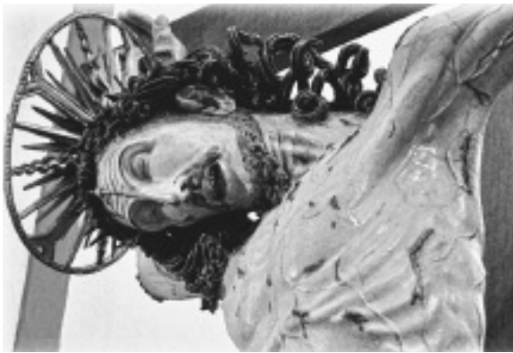
Un'immagine dell'opera lignea del Ss. Crocifisso (maggiori informazioni sul sito internet www.parcocchiasantaagata.com )

Il programma prevede, alle ore 18,15, il Rosario meditato cui seguirà la Santa Messa di suffragio per tutti i defunti della parrocchia e reposizione del venerato Simulacro nella propria cappella.