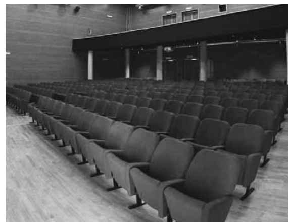
Alcune immagini della Sala