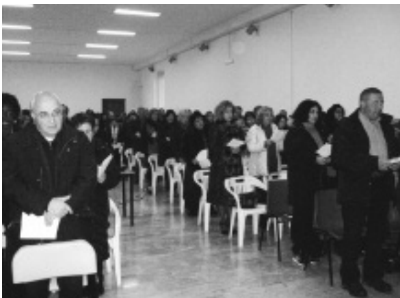
L'assemblea presente domenica scorsa a Casamari