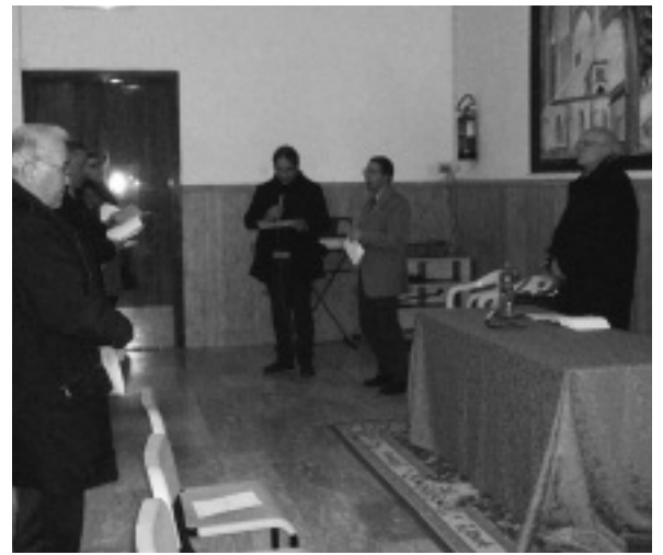
La recita dei Vespri