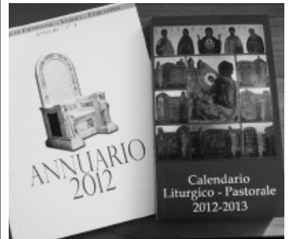
La copertina del nuovo calendario liturgico-pastorale e dell'annuario

È disponibile la nuova edizione del calendario liturgico-pastorale della nostra Diocesi: in una comoda versione tascabile contiene tutti gli appuntamenti e le celebrazioni in programma. È in distribuzione presso la segreteria della Curia nei normali orari di ufficio.