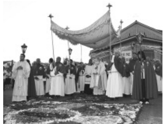
Un'istantanea della processione del Corpus Domini dello scorso anno

Giovedì 7 giugno: in serata, a Frosinone, celebrazione diocesana per il Corpus Domini.