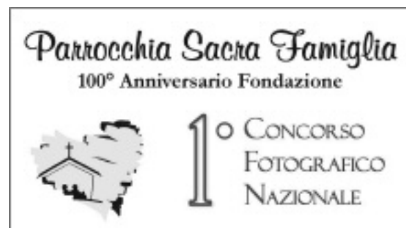
Il logo del Concorso

La copia del bando e della relativa scheda di partecipazione potranno essere ritirate in parrocchia o essere scaricate dal sito internet www.asfotofr.it .