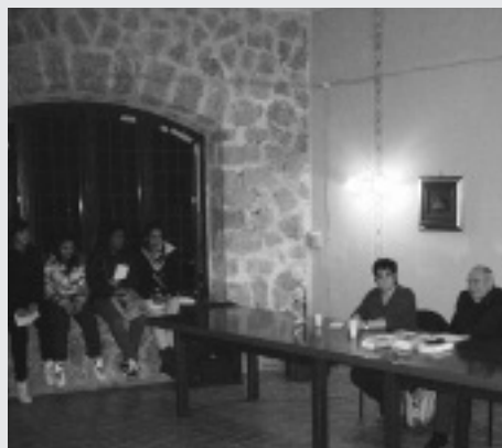
Un momento dell'iniziativa conclusiva di venerdì 1 febbraio

Si sono concluse venerdì 1° febbraio, ad Amaseno, le celebrazioni per la Giornata della Memoria 2013.