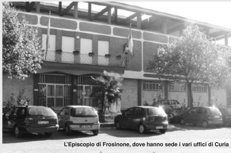
L'Episcopio di Frosinone, dove hanno sede i vari uffici di Curia

Tutti gli uffici di Curia saranno chiusi al pubblico nei giorni compresi tra mercoledì 8 agosto e mercoledì 22 agosto p.v.