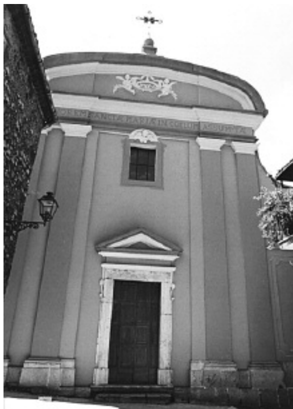
Nell'immagine, una veduta esterna della chiesa di Santa Maria Assunta in Cielo