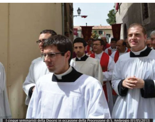
I cinque seminaristi della Diocesi in occasione della Processione di S. Ambrogio (01/05/2013)

Maggiore; in entrambe le celebrazioni eucaristiche ha raccontato la sua vocazione e la sua vita giornaliera in seminario. Nella Messa delle 11 i giovani della parrocchia hanno portato processionalmente, dal palazzo Colonna alla chiesa, la croce e il trono del Re, Cristo (domenica 24 e alla solennità di Cristo Re); molti erano i ministranti che