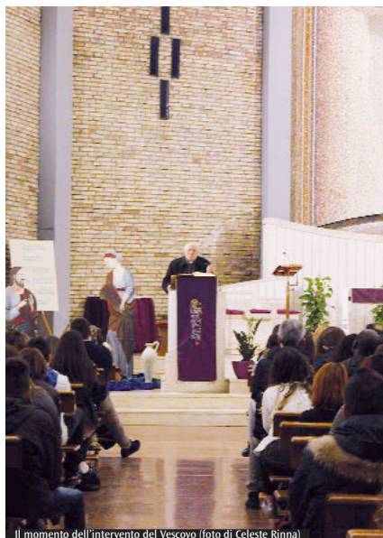
Il momento dell'intervento del Vescovo