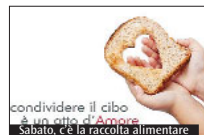
condividere il cibo è un atto d'amore. Sabato, c'è la raccolta alimentare

Raccolta alimentare promossa dalla Caritas Diocesana a sostegno degli interventi caritatevoli parrocchiali: troverete i volontari presso i supermercati aderenti. Info su http://caritas.diocesifrosinone.it