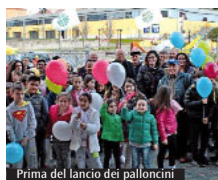
Prima del lancio dei palloncini

quello di "Campagna Amica" di Goldiretti e quello di "La Bottega Equa" che promuove il mercato Equo e Solidale e fa riferimento alla Caritas diocesana. Dopo la presentazione del Parroco, mons. Sossio Lombardi e del vice, don Dino Mazzoli, c'è stato un breve momento di preghiera del Vescovo Ambrogio, il saluto del Sindaco Ottaviani e dei rappresentanti delle già citate organizzazioni; poi, è iniziata la festa con il coloratissimo lancio dei palloncini da parte delle bambine e dei bambini presenti. Il volo dei palloncini, oltre a portare nel cielo le preghiere per papà, ha dato voce a quanto riportato nella predetta Esortazione Apostolica: «... desideriamo però ancora di più, il nostro sogno vola in alto. Non parliamo solamente di assicurare a tutti il cibo, o un "decoroso sostentamento", ma che possano avere "prosperità nei suoi molteplici aspetti"». Frase scritta il 15 maggio 1961 da San Giovanni XXIII, nella Enciclica Mater et Magistra.