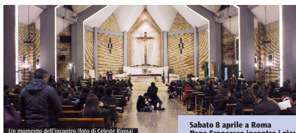
Un momento dell'incontro