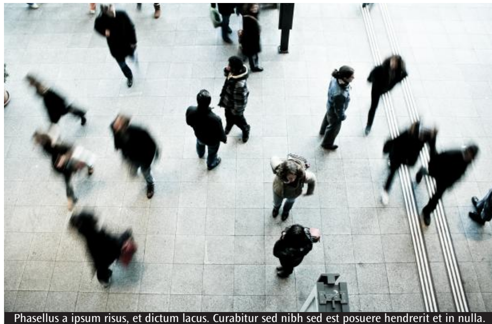
Phasellus a ipsum risus, et dictum lacus. Curabitur sed nibh sed est posuere hendrerit et in nulla.