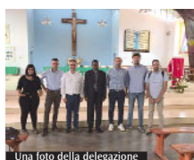
Una foto della delegazione

Importante anche la visita alla nuova parrocchia di Kora che è in costruzione, in cui è stato da poco nominato parroco don Epimache Makuza che sta terminando il periodo di permanenza per studio nella nostra Diocesi di Frosinone. La delegazione ha anche partecipato alla celebrazione della festa di Maria SS. ma Assunta nel Santuario diocesano di Crete Congo NI, importante appuntamento annuale per la Diocesi di Nyundo. Oltre a Mons. Moumvanza erano presenti Mons. Philippe Rukamba, vescovo di Butare e presidente della Conferenza Episcopale del Rwanda