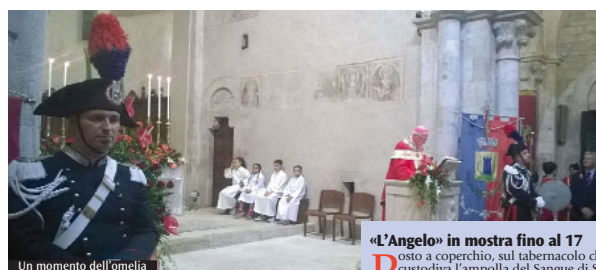
Un momento dell'omelia