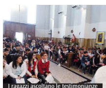
I ragazzi ascoltano le testimonianze

importante riscoprire il servizio fatto con amore e per amore, in un mondo difficile dove sembra vincere l'indifferenza, l'individualismo e la violenza». Il messaggio di pace che è portato dal Signore «è un inizio della vita di fede che ci fa scoprire la bellezza dell'incontro e della solidarietà, dell'amore verso chi è solo o abbandonato». Il Vescovo ha anche voluto ringraziare i ragazzi per la loro scelta di voler fare la cresima, in un mondo in cui si rimandano sempre le scelte importanti. Nella seconda parte dell'incontro, i ragazzi si sono divisi in più di 20 gruppi di condivisione guidati dai loro catechisti, che hanno partecipato