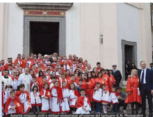
Autorità religiose, civili e militari immortalati all'esterno del Santuario

Vangelo: ascoltare, conoscere, pascere. «E' anzitutto Gesù che ci ascolta e ci conosce, perché conoscere è amare. Per questo è pastore, cioè si prende cura di noi», ha detto il presule. Queste tre parole sono anche una proposta per ciascuno di noi. Rappresentano innanzitutto un invito ad «ascoltare Gesù e non noi stessi» e poi, esortano ad «ascoltarci tra noi in un mondo dove ci si ascolta poco