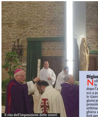
Il rito dell'imposizione delle ceneri

«La preghiera è la via migliore per vivere con Gesù. Ci dovremmo chiedere quanto tempo dedichiamo alla preghiera», scrive papa Francesco nel messaggio per la Quaresima. Il Vangelo insiste sulla preghiera personale, nella propria camera. Non che non sia necessario pregare con gli altri, con le nostre comunità, come facciamo oggi. La preghiera ci aiuta a uscire da noi stessi, dalle nostre paure, dal nostro piccolo