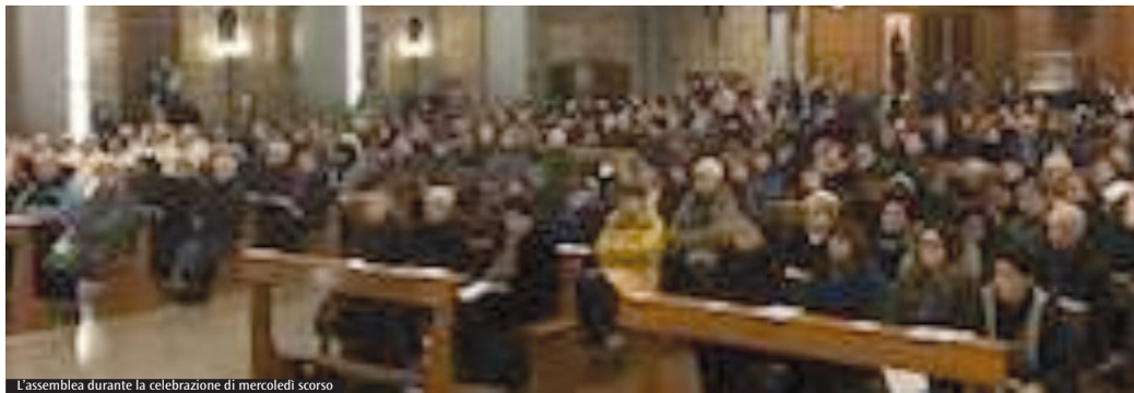
L'assemblea durante la celebrazione di mercoledì scorso