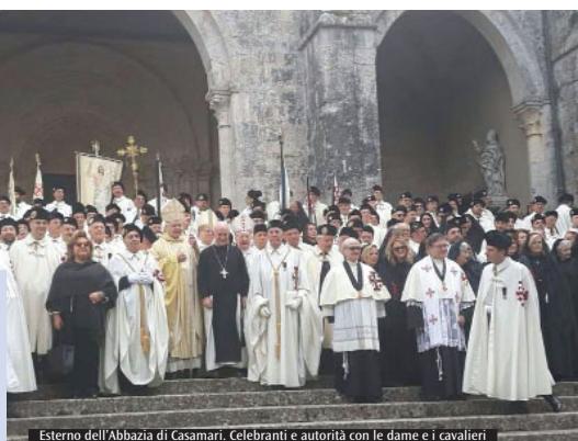
Esterno dell'Abbazia di Casamari. Celebranti e autorità con le dame e i cavalieri

e le strutture presenti in quei luoghi, sotto la guida diretta del Patriarcato di Gerusalemme. L'Ordine Equestre del Santo Sepolcro di Gerusalemme è uno dei due ordini riconosciuti dal papato e quindi gode di personalità giuridica canonica e civile. Si entra a far parte dell'Ordine per svolgere un'attività di servizio in favore della Chiesa