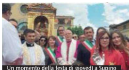
Un momento della festa di giovedì a Supino

Dopo l'accoglienza in piazza Umberto I, il vescovo Spreafico ha presieduto la messa nel santuario. Nell'omelia, partendo dalla pericope evangelica di Gv 10,11-18, ha spiegato: «Il Signore è il Buon Pastore, ci conosce, è sempre vicino a noi. Non è e fa come il mercenario; quante persone non si interessano per le altre, l'indifferenza a volte è di portata di mano. Il Buon Pastore ci aiuta a capire come essere in questo mondo, e ve lo indico con tre parole: