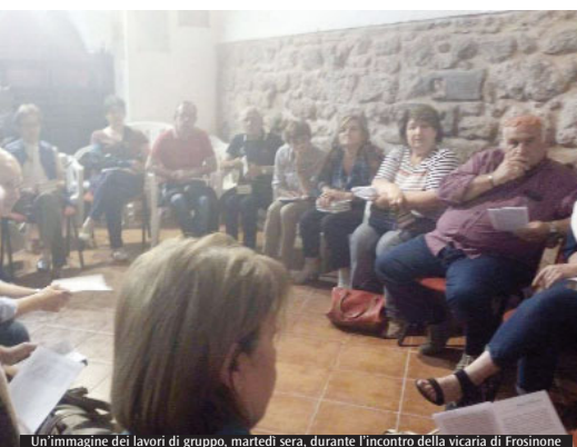
Un'immagine dei lavori di gruppo, martedì sera, durante l'incontro della vicaria di Frosinone