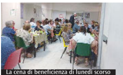
La cena di beneficenza di lunedì scorso