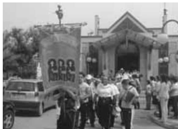
Una precedente edizione del pellegrinaggio