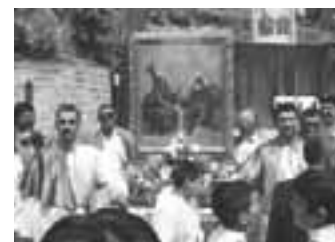
Un'immagine degli anni scorsi

Alle 10.30, dopo la Messa Solenne avrà luogo la processione con la Sacra Icona della SS.ma Trinità. Nel pomeriggio, recita del Rosario alle 18.30 e S. Messa alle 19.30.