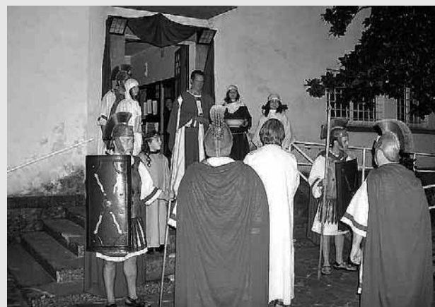
Un immagine da Villa S.Stefano