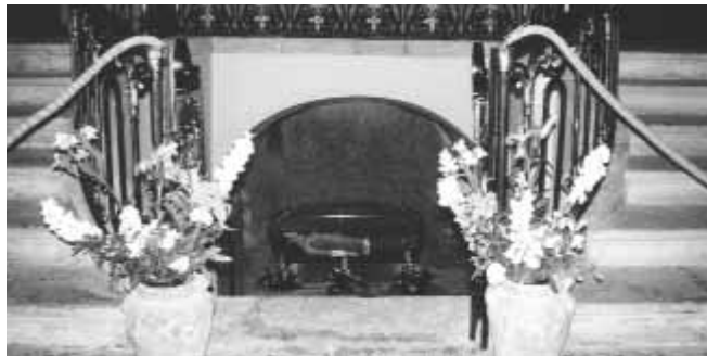
La cripta della chiesa